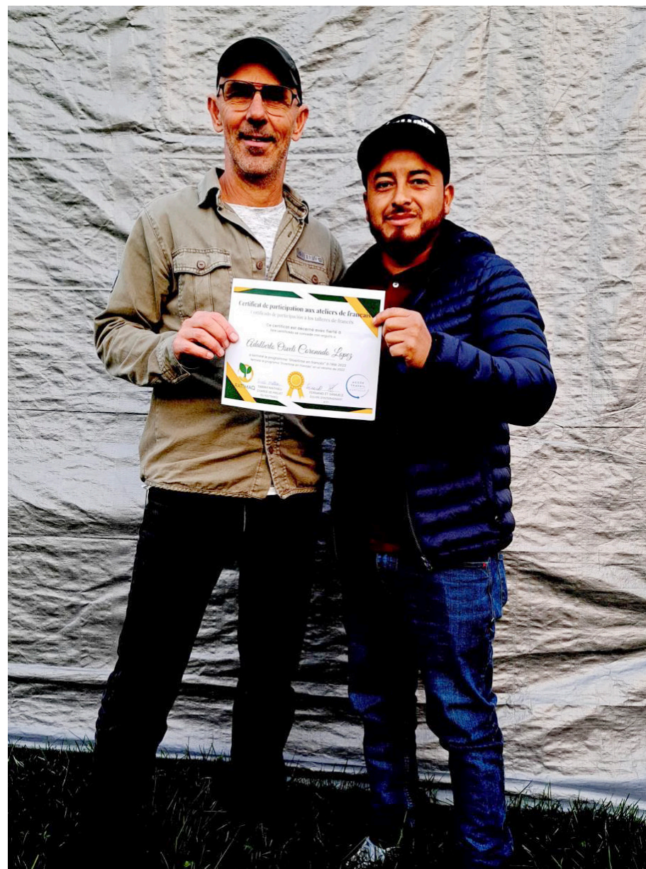
À la fin de l'été, les participants ont reçu un diplôme de fréquentation témoignant de leurs efforts pour apprendre le français.

La réponse a été surprenante : une trentaine de travailleurs étrangers temporaires se sont présentés aux premiers ateliers. Pendant les mois de juillet et août, le nombre des