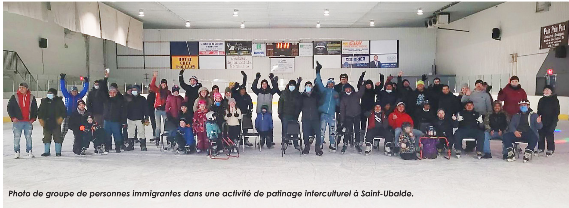
Photo de groupe de personnes immigrantes dans une activité de patinage interculturel à Saint-Ubalde.

La région de Portneuf a fort longtemps ouvert ses bras pour accueillir de nouveaux arrivants, soulignant son caractère multiculturel qui a depuis continué son évolution. Les travailleurs issus de presque tous les continents y sont maintenant représentés. Aujourd'hui, nous voyons davantage cette diversité dans nos communautés. Il y a déjà très longtemps que de nouveaux arrivants ont commencé à s'établir dans notre région. On pourrait citer entre autres les Irlandais dans la municipalité de Portneuf dans les années 1860. Depuis cette période, l'immigration dans la région de Portneuf prend forme progressivement avec des hauts et des bas jusqu'à une augmentation significative ces dernières années. Selon les données de Statistique Canada, en 2021, il y a eu 875 personnes immigrantes dans la région de Portneuf. Aujourd'hui, ces chiffres pourraient facilement avoisiner 1 500 personnes immigrantes compte tenu des nouvelles arrivées depuis 2021. On remarque l'arrivée d'une nouvelle nationalité (Philippins) et l'augmentation d'autres (Camerounais, Tunisiens, Marocains, Guatémaltèques, etc.), toutes travaillant dans les entreprises d'ici. L'expansion de