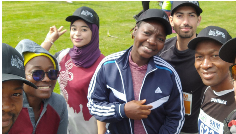
La Course du maire 2023, à Donnacona.

Dans Portneuf, le plat mexicain que l'on partage au restaurant est de plus en plus souvent préparé par un collègue de travail originaire du Mexique ou sa compagne. Le match de soccer de la fin de semaine entre amis revêt des allures internationales avec de nouveaux participants très doués, venus d'autres pays. Le blé d'Inde renommé de la région est à coup sûr cueilli par un travailleur agricole saisonnier étranger. Chaque ville de la région est aujourd'hui plus riche de personnes venues d'ailleurs, désireuses de découvrir les coutumes locales. Ces personnes venues d'autres régions ou d'autres pays ont amené un peu de leur riche